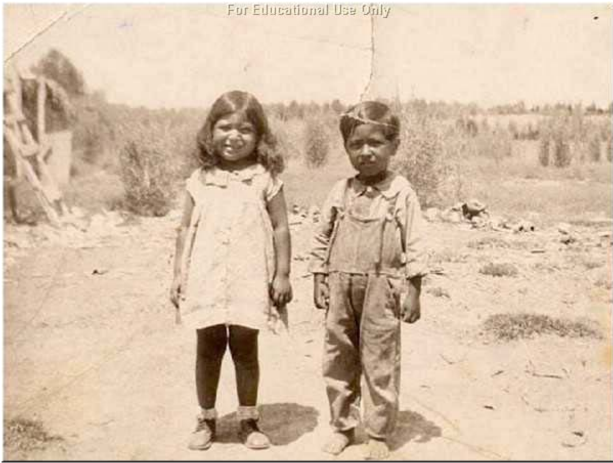
César và chị đang đứng ngoài nhà của họ.