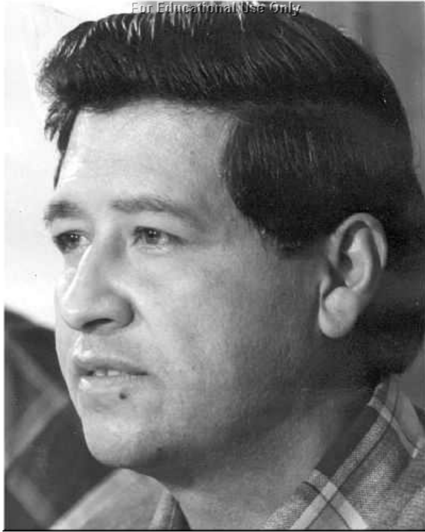
Diam duab no tuaj los ntawm UFW tuaj.

Thawj coj ntawm ib pab; Thawj coj ntawm kev caj ncees; Thawj coj ntawm sab ntsuj plig; Nws povhwm liaj ias tebchaws; Nws la meej pej xeem; ua haujlwm zoo ncaj ncees