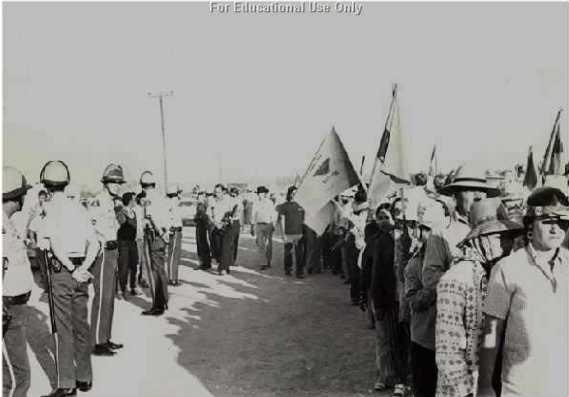
Diam Duab no tau raug kev povhwm, El Macriado Cov neeg ua picket thiab ua strike ntawm daim txiv hmab hauv Coachella hauv xyoo 1973.

no ua rau cov neeg Asmelikas pom hauv lub this vis thiab lawv hu xovxwm no ua “The Harvest of Shame.” Cov neeg thiab cov thawj coj hauv lub tebchaws Asmelikas pom Cesar thiab cov neeg ua strike. Lawv paub hais tias lawv xav raug kev ncaj ncees xwb. Cesar nug cov neeg Asmelikas ua boycott thiab tsis yuav txiv hmab. Thaum ua boycott cov tswv teb lossis cov tswv num tsis khwv nyiaj vim cov neeg uas ua boycott tsis kam yuav lawv koom. Tsis ntev tom qab ntawd, cov tswv num tswv teb yuav tsum nrog cov neeg ua num sib tham seb puas muaj chaw sib haum. Cesar ntseeg hais tias cov neeg Amelivkas paub kev ncaj ncees. Ntau leej Amelivkas kam ua boycott thiab tsis yuav txiv hmab. Lawv to taub hais tias cov neeg ua num ua liaj ua teb raug kev tsis ncaj ncees.