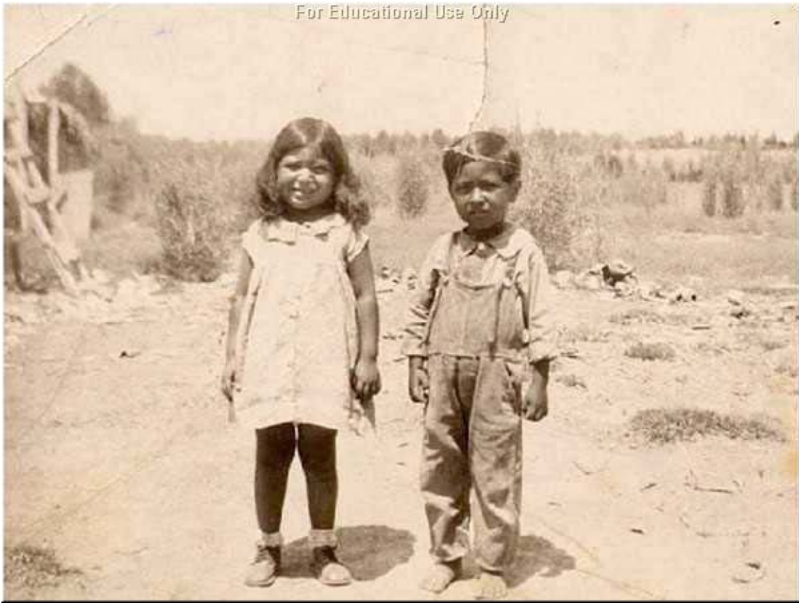
tuaj Cesar thiab nws tus muam sawv nraum nkawd lub tsev.