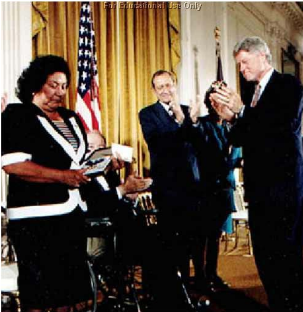
Diam duab no tuaj losntawm Cesar E. Chavez Foundation

Helen Chavez theej Cesar chaw txais nws khoom plig no hu ua Presidential Medal of Freedom losntawm tus toom txoov Bill Clinton thaum ua ib kabke nyob ze lub tsev xim dawb.