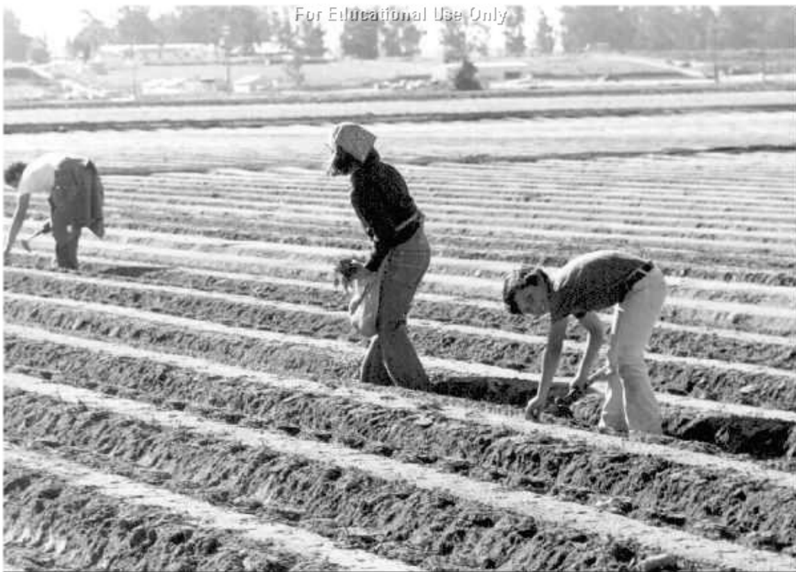
Diam duab no tau raug kev povhwm

Cov menyuam yaus ua haujlwm cog txiv pos nphuab hauv lub hav Santa Maria hauv xyoo 1970.