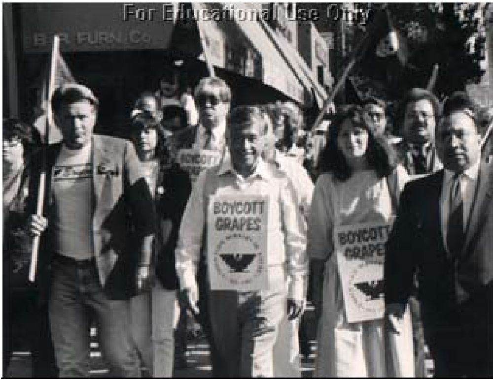
Diam duab no tau raug kev povhwm

Cesar mus kotaw pub nws kev pab rau txiv hmap boycott. Martin Sheen sawv ze nws sab laug.