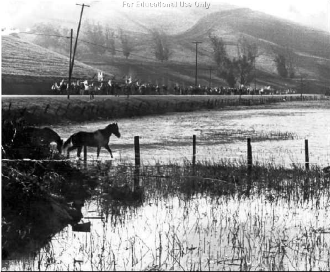
Diam duab no tau raug kev povhwm, El Macriado

Cov neeg ua liaj ua teb thiab cov neeg uas pab lawv, mus ze ib lub teb thaum lawv mus kotaw nram Stockton