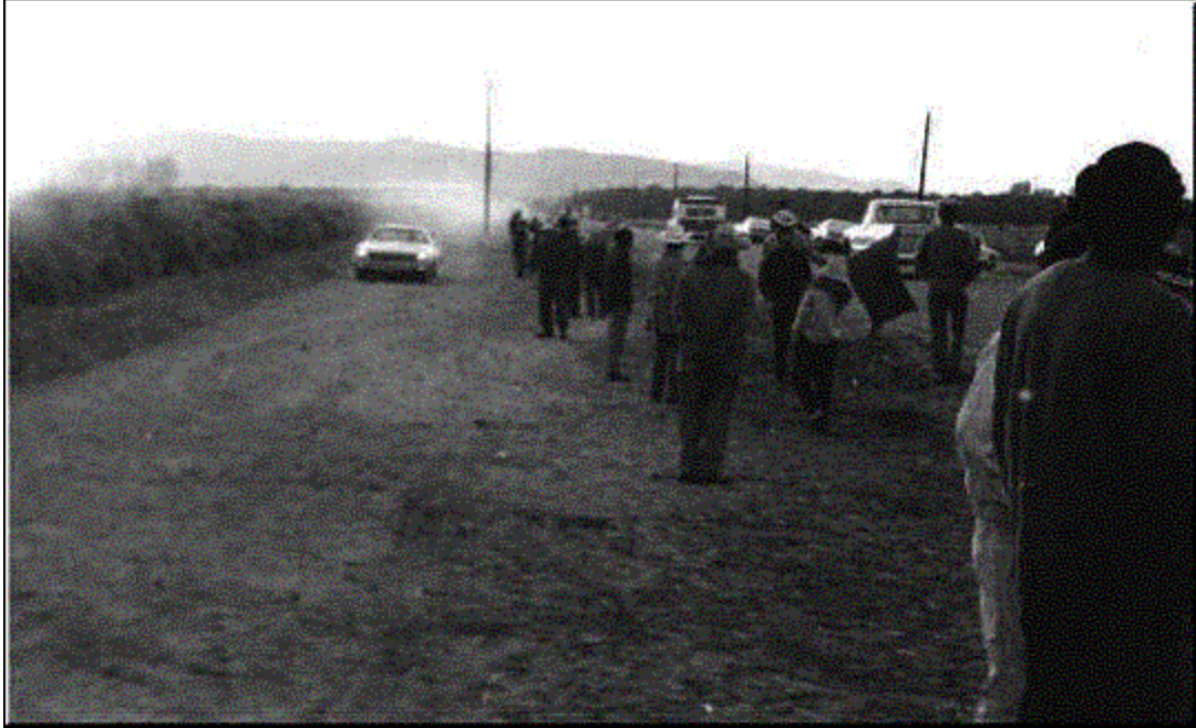
Diam duab no tau raug kev povhwm

Cov neeg ua strike hauv lub teb thaum sawvntxov thaum ua txiv hmap strike hauv xyoo 1973.