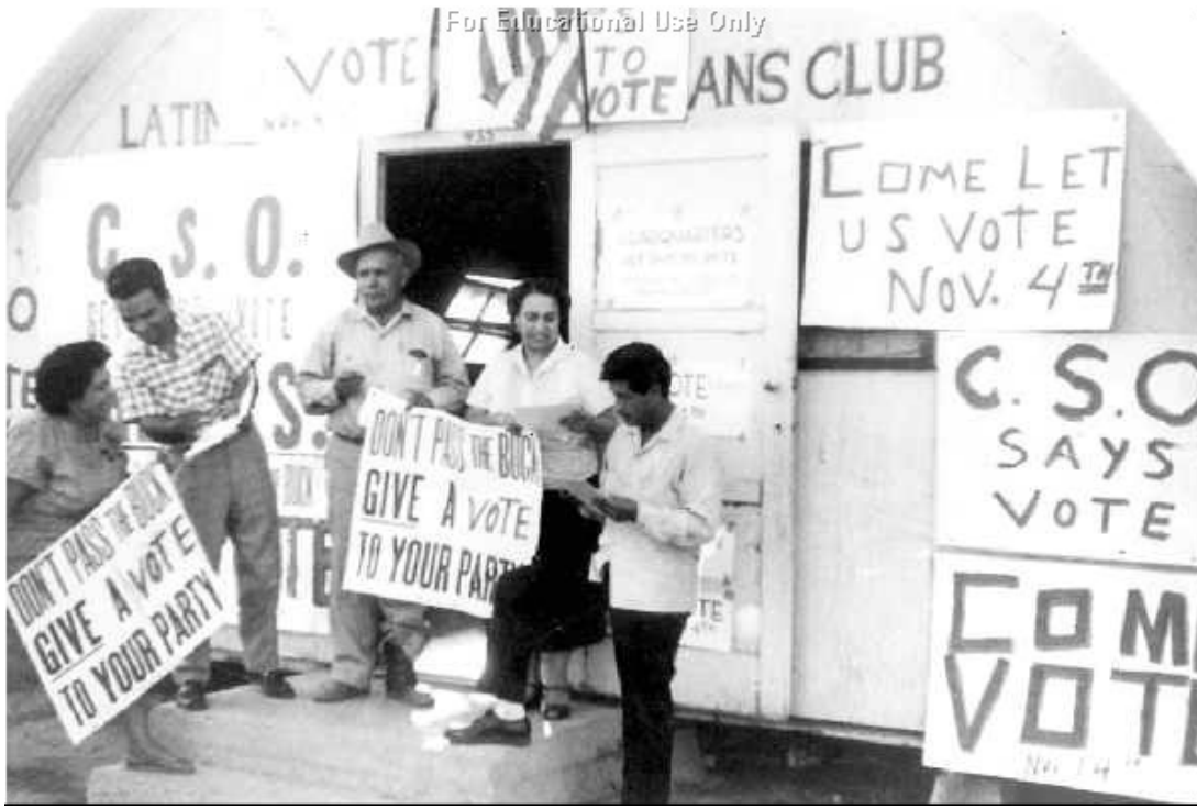
Diam duab no tuaj los ntawm United Farm Workers tuaj Cesar thiab ob peb tug los ntawm Community Service Organization npaj pov ntawv xaiv.

Hauv xyoo 1952, Cesar nstib Fred Ross uas ua haujlwm muab rau Community Service Organization (CSO), uas yog ib lub koom txoos uas pab neeg hauv lawv lub zos. Fred Ross ghia hais tias cov neeg txom nyem txais tau hwjchim thiab pib pab lawv tus kheej. Cesar pib ua haujlwm muab rau CSO thiab pab ntau leej Latino nrog tseem fwv sau npe kom txawj pov ntawv xaiv. Cesar hloov los ua ib tug coj kev hauv CSO hauv California. Hauv Oxnard, California, Cesar pab cov neeg uas ua liaj ua teb txais lawv txoj haujlwm dua, tiamsis tsis ntev tom gab ntawd lawv tus tswv num thiaj li txo lawv. Cesar paub hais tias cov neeg uas ua liaj ua teb yuav tsum tsim ib pab neeg uas yuav pub rau lawv hwjchim yeej tau kev sib cog lus raws cai uas yuav pov hwm lawv kev ncaj ncees. CSO tsis kam tsim pab no. Vim li ntawd, Cesar txhob ua haujlwm muab rau CSO kom txawj tsim tau ib pab neeg ua liaj ua teb.