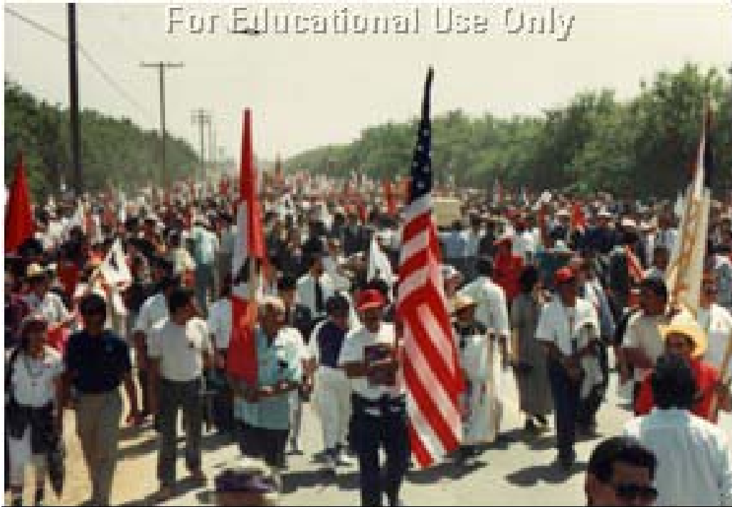
Diam duab no tau raug kev povhwm Ntau leej tuaj Cesar kev pam tuag.

Cesar E. Chavez ua haujlwn mus txog lub hnuv thaum nws tuag. Nws tuag thaum nws pw lub plaub hlis ntuj hnuv 23, 1993 hauv San Luis, Arizona. Lawv ua nws kev pam tuag lub plaub hlis ntuj hnuv 29, 1993 hauv Delano, California thiab peb caug txhiab leej tuaj. Lub sijhawm ntawv tau ua lub sijhawm kawg uas cov neeg no pub kev hwm rau nws.