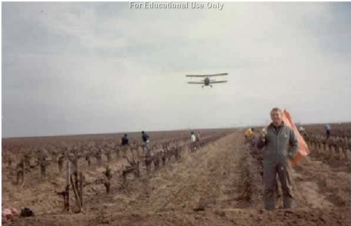
Diam duab no tuaj losntawm United Farm Workers tuaj

Kwvyees li xyoo 1880, Cesar mus cov lav uas nyob nruab ntsab thiab nyob sab hnuv tuaj lub tebchaws Asmelikas qhia neeg tej yam phem txog tshuaj ua tua kab uas lawv tsuag rau saum lawv cov qoob loo. Tshuaj ua tua kab no uas kom cov neeg ua liaj ua teb mob heev tej zaum tuag thiab thaum lawv yug menyuum tej zaum tus menyuum ntawd yuav mob heev thiab. Cesar yoo mov 36 hnuv kom neeg pom tej kev phem no uas los ntawm tshuaj uas tua kab. Tej txhiab neeg pub lawv kev pab rau nws. Lawv yoo mov 3 hnuv thiab qhia lwmtus txog tej xov no. Thaum hnuv kawg, cov tswv num uas cog noob kam mloog Cesar kev txhawj txog tshuaj uas tua kab thiab pib rov xyuas dua lawv kev siv tshuaj no. Lub lav California rov xyuas dua lawv kev siv tshuaj uas tua kab thiab.