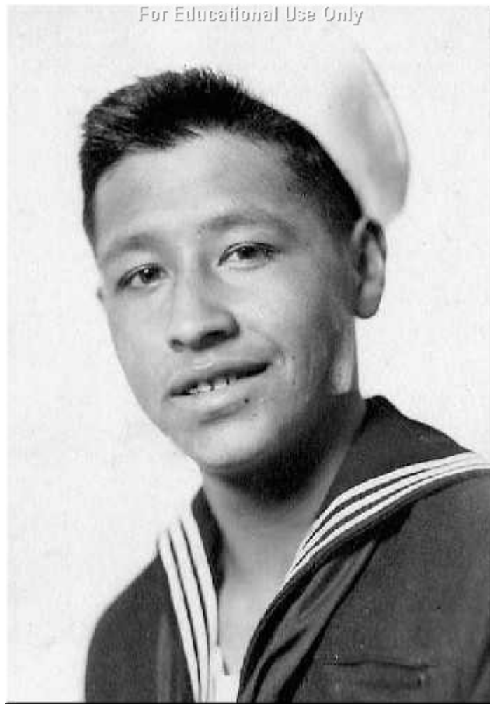
Cesar nakasuot ng Navy uniporme.

Naging miyembro si Cesar sa 1944 ng US Navy at naglinkod siya sa abroad sa mga pulang para sa dalawang taon. Habang nasa Navy niya napansin niya na maraming tao